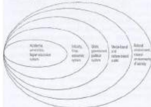
Gambar 1. Quintuple helix

dan kesempatan pasar kedelai (terutama domestik), akuntabilitas program (saat dirumuskan, dimonitor saat berlangsung, dievaluasi hasil dan dampaknya), terkonfirmasi secara jitu proses, hasil, dan antisipasinya pada perbaikan rencana masa yang akan datang (futuristik), dan upaya-upaya yang dilakukan dalam jangka pendek, menengah, dan jangka panjang.