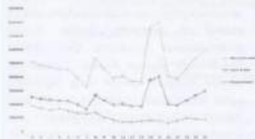
Pemertumbuhan Kebutuhan Kedelai, Impor Kedelai, dan Produksi Kedelai (Tahun 1990-2012)