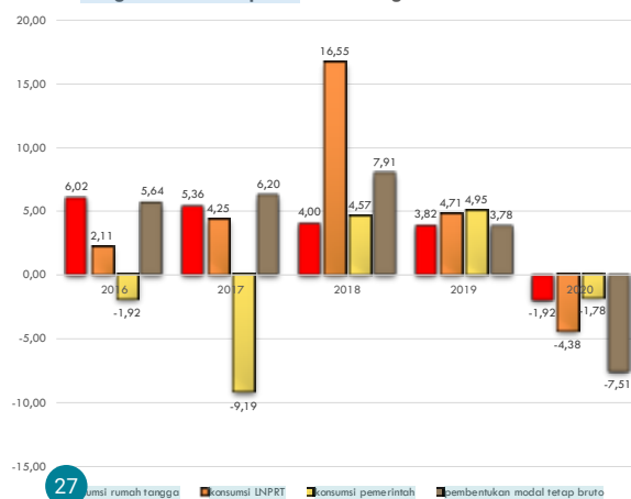
46 Laju Pertumbuhan PDRB ADHK 2010 Menurut Pengeluaran Kabupaten Sumedang 2016-2020

Pertumbuhan ekonomi merupakan cerminan dari seluruh kegiatan ekonomi yang ada disuatu wilayah, dilihat dari tahun 2016 - 2020 pertumbuhan ekonomi di Kabupaten Sumedang selalu mengalami kenaikan yang fluktuatif dari tahun ke tahun.