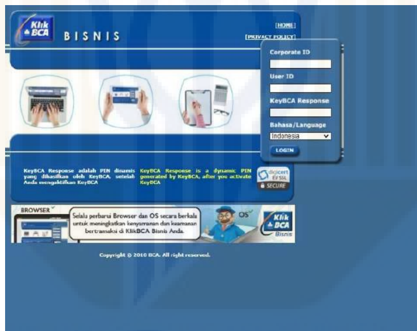
Gambar 11. Tampilan Log In Ke BCA