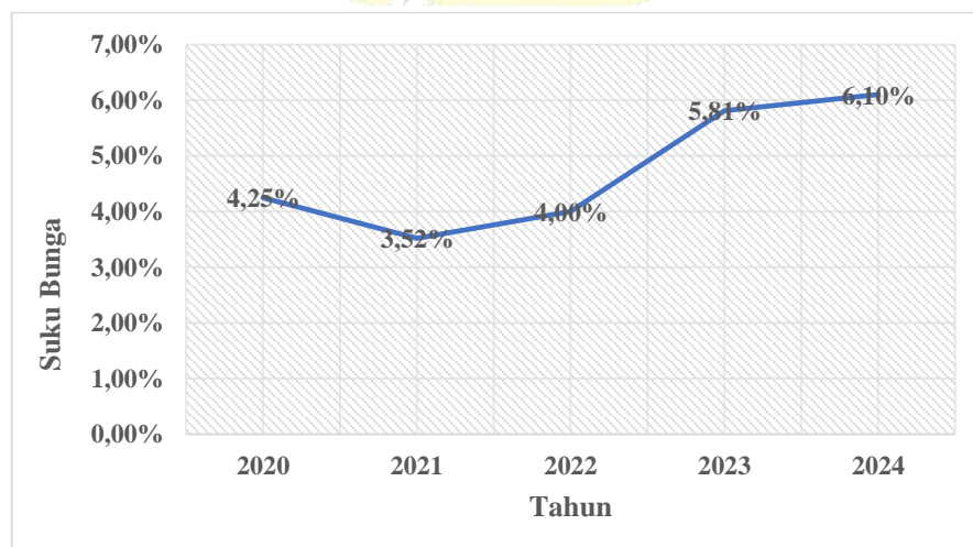
Gambar 1. 4 Rata – Rata Tingkat Suku Bunga Di Indonesia Periode 2020 – 2024 Sumber data: Bank Indonesia 2020 -2024