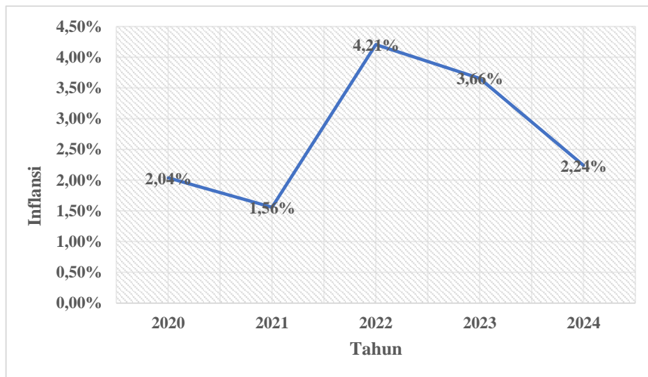
Gambar 1.3 Rata – Rata Tingkat Inflasi di Indonesia Periode 2020 – 2024 Sumber data: Bank Indonesia 2020 -2024

peningkatan harga barang lainnya. Berikut adalah visualisasi tingkat inflasi yang terjadi di Indonesia pada tahun 2020 – 2024.