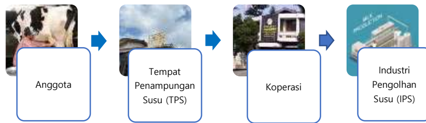
Gambar 1.2 Distribusi Susu Sapi Perah KUD Mandiri Bayongbong

Gambar di atas merupakan rangkaian kegiatan pendistribusi yang sangat menentukan bagi suatu perusahaan atau koperasi di mana hasil produksi (produk) dikirim kepada konsumen atau IPS untuk dikelola dan dipasarkan kembali dengan tujuan untuk memudahkan pemasaran produk. KUD Mandiri Bayongbong, sebagai perusahaan atau koperasi yang bergerak dibidang pemasaran susu sapi di kawasan Garut. Di mana susu sapi diperoleh dari para peternak, yang diambil di tempat penampungan susu (TPS) di kawasan Bayongbong. Susu sapi yang telah ada di Tempat Penampungan Susu (TPS) kemudian dibawa ke Laboratorium untuk diperiksa Standar Quality yang telah ditentukan oleh koperasi peternak sapi, sehingga siap untuk dipasarkan ke distributor, yaitu Industri Pengolahan Susu (IPS). Berdasarkan data Laporan tahunan KUD Mandiri Bayongbong tahun 2018-2022 KUD Mandiri Bayongbong telah memasok produk susunya ke beberapa IPS, seperti: PT. Frisian Flag Indonesia, PT Diamond Cold Storage, PT Cimory, PT ABC Kogen Dairy.