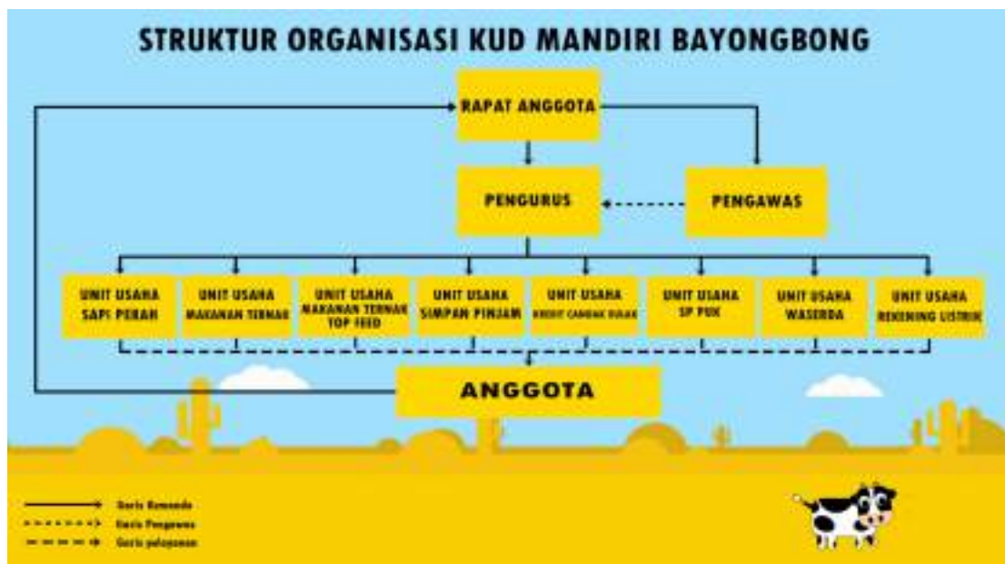
Gambar 4. 1 Struktur Organisasi KUD Mandiri Bayongbong