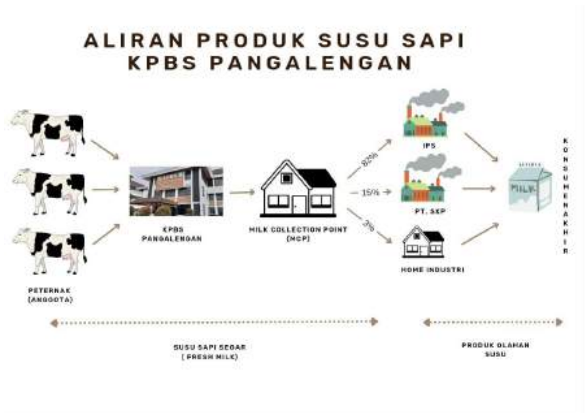
Gambar 1. 2 Aliran Produk Susu Sapi Segar KPBS Pangalengan

Pada Gambar 1.2 menunjukkan aliran produk pada susu sapi segar yang dimulai peternak (anggota), Koperasi, Industri Pengolahan Susu (IPS) hingga ke konsumen akhir. Sehingga susu sapi yang ditampung di koperasi akan di distribusikan lagi ke IPS rata-rata sebesar 82%, PT.SKP sebesar 15%, dan sisanya home indutri hanya sebesar 3%. Dari sini dapat disimpulkan saluran produk susu segar pada unit PT.SKP hanya sedikit untuk diolah menjadi produk olahan seperti susu pasteurisasi, yogurt dan keju mozzarella. Hal ini disebabkan karena adanya penurunan produksi pada setiap produk olahan susu sebagai berikut: