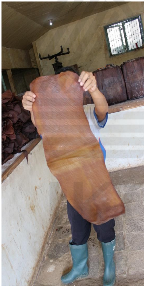
Produk Karet Olahan RSS (Kiri)