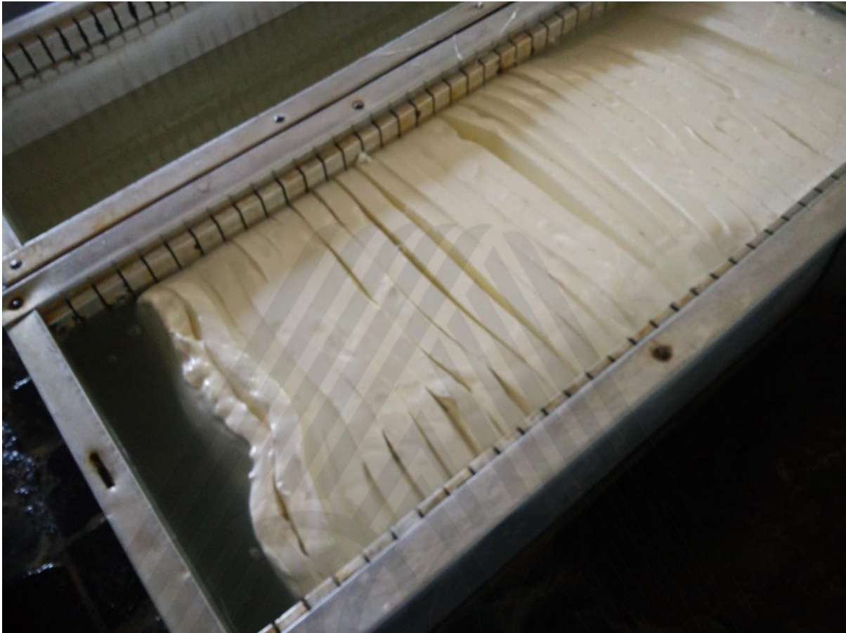
Lembaran Sheets Karet Olahan dalam Bak Koagulasi