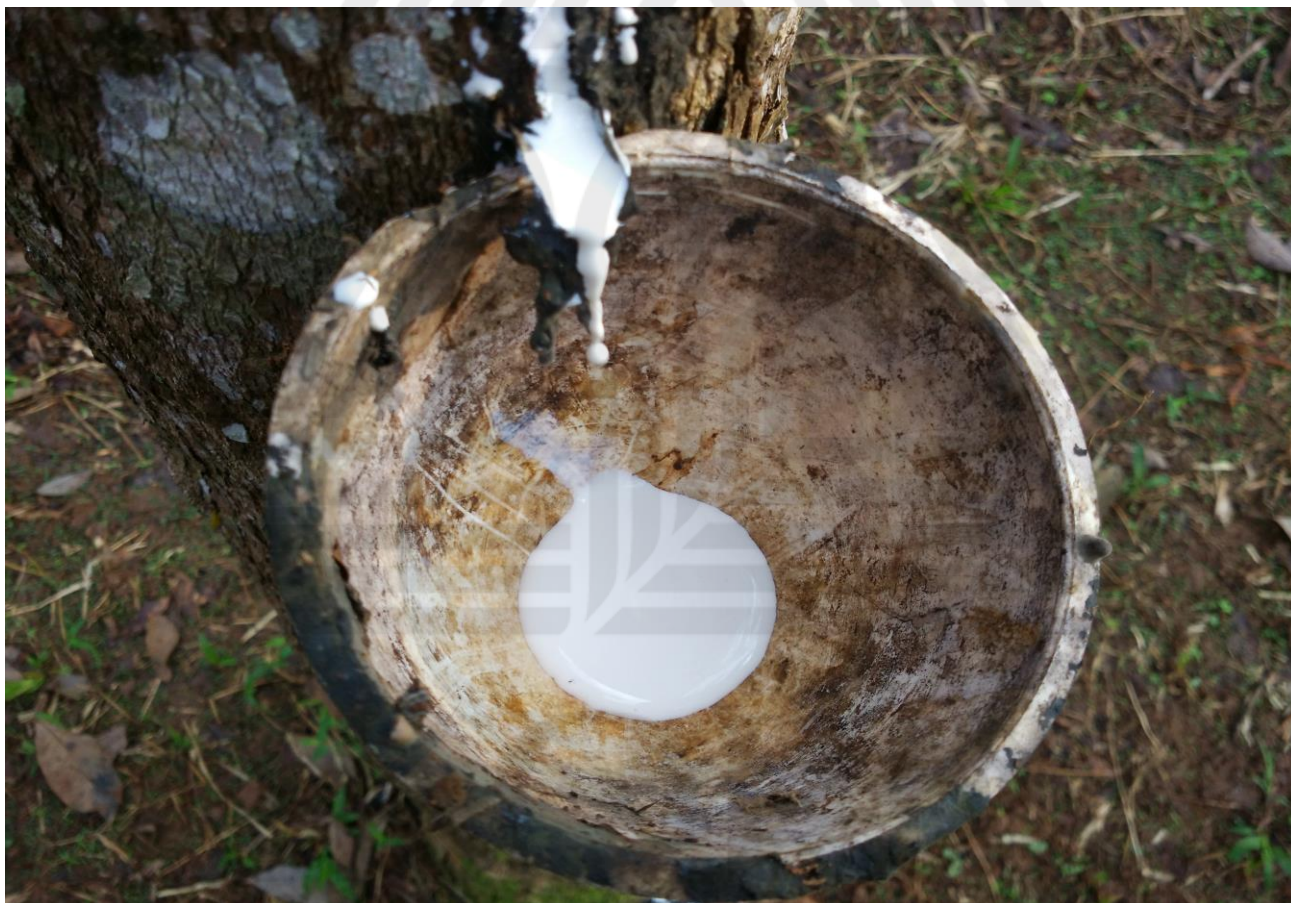
Proses Penyadapan Lateks