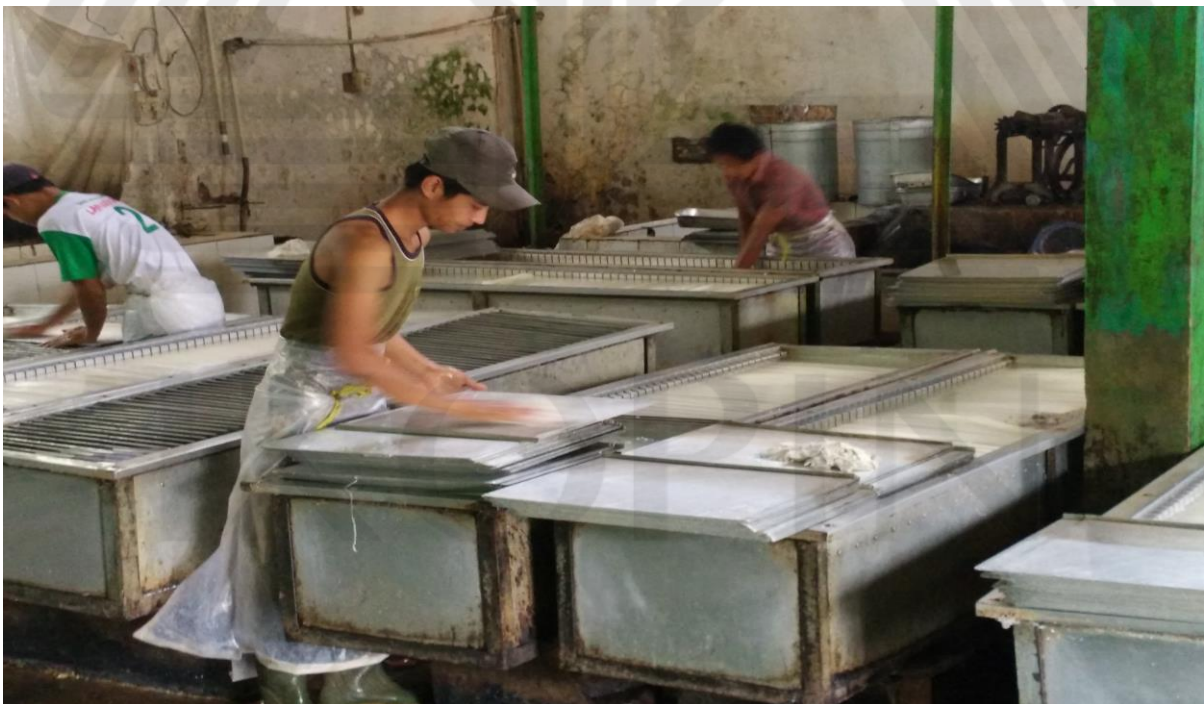
Keadaan di Pabrik Pengolahan Karet