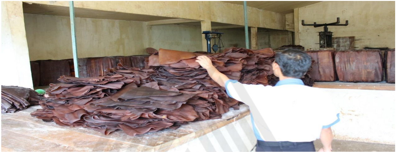
Gudang Penyimpanan Produk Karet Olahan (atas)