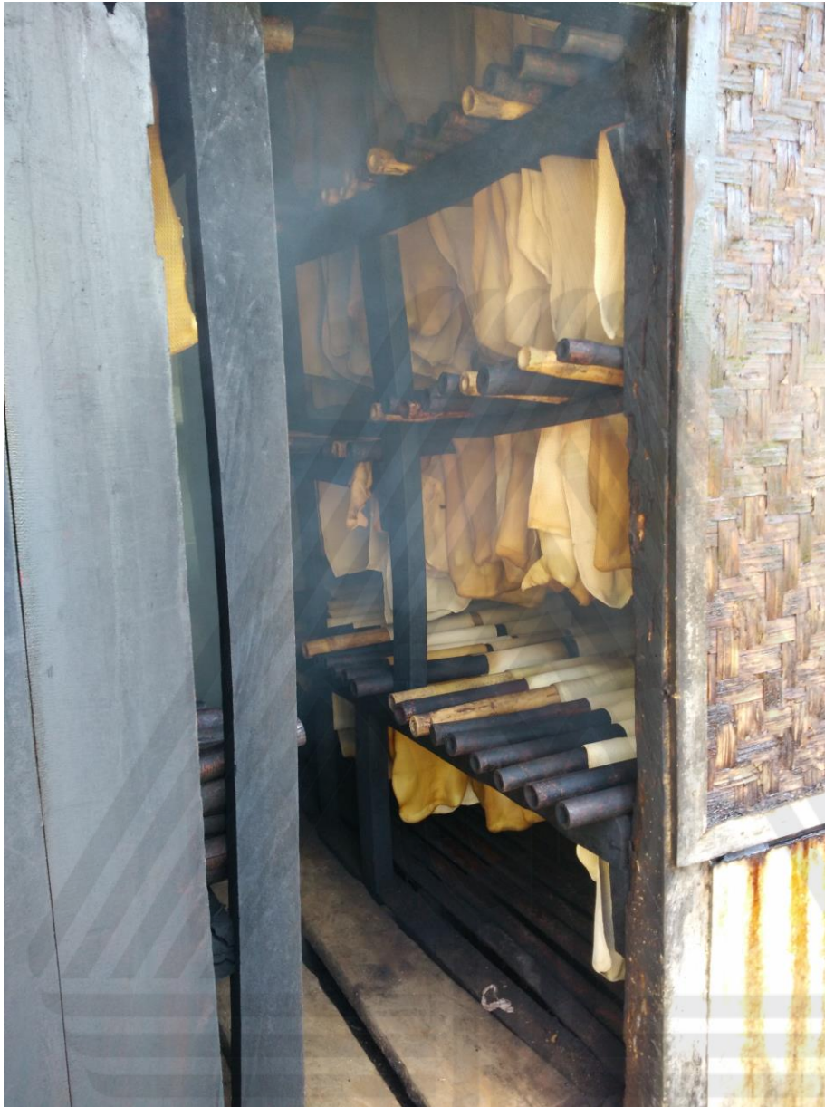
Rumah Asap Pengolahan Karet (Kiri)