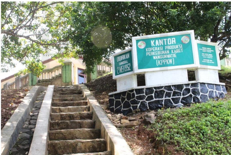
Halaman depan Kantor Koperasi