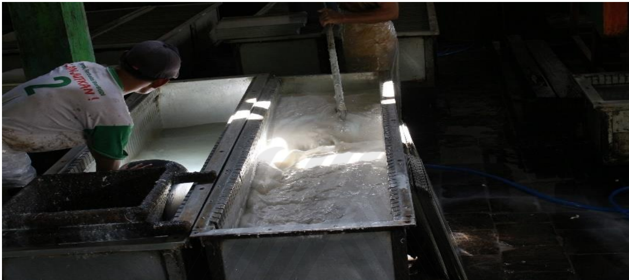
Proses Pengadukan Lateks dalam Bak Koagulasi