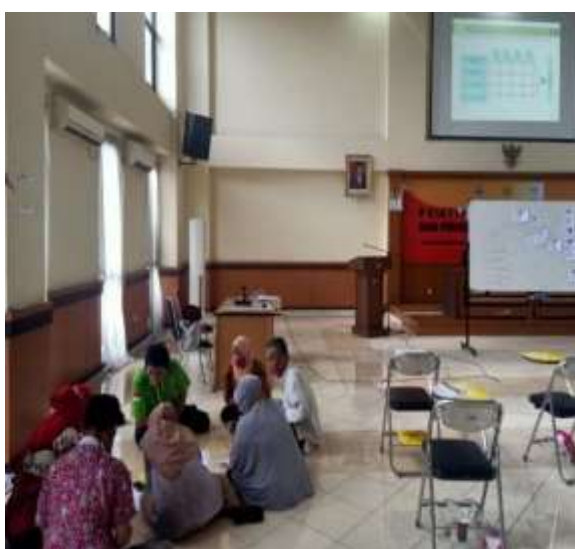
Gambar 2. Bedah Kasus dan Latihan Pemecahan Masalah

Materi inti yang disampaikan adalah sebagai berikut: