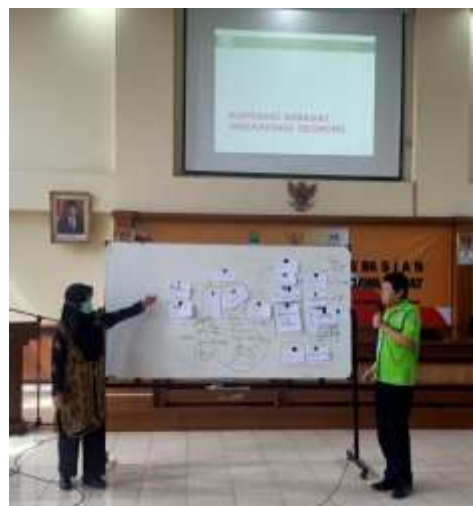
Gambar 3. Presentasi Hasil Diskusi

Tenaga administrasi menyiapkan dan mendukung administrasi dan sarana lainnya untuk seluruh kegiatan, mulai perencanaan, pelaksanaan dan evaluasi kegiatan serta pelaporan. Pelaporan hasil dilakukan setelah seluruh rangkaian kegiatan dilaksanakan.